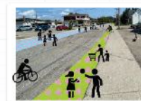
rue Rhains rétrécie