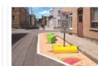
aire de jeux