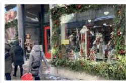
temps des fêtes