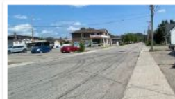
rue Rhains aujourd'hui