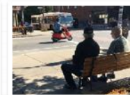
aire de repos