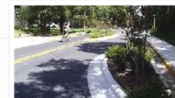
aménagement en zigzag