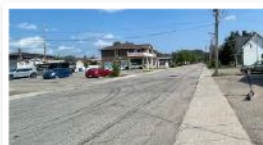
rue Rhains aujourd'hui